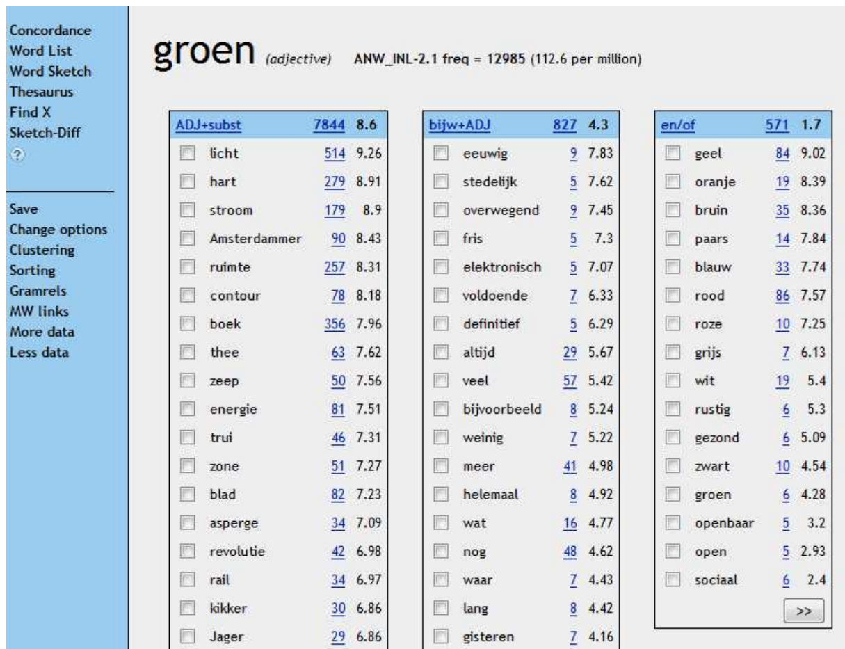
Figure 1 - (part of) the word sketch of the adjective groen 'groen'

The patterns found are divided into subgroups based on grammatical patterns or word class membership. As can be seen above, there is a category for ADJ (adjective) + subst (substantive; noun), where one can find combinations as groene stroom 'green power' and groene thee 'green tea'. Other categories are for example bijw ( bijwoord 'adverb') + ADJ (adjective), en/of 'and/or', ADJ + ww ( werkwoord 'verb' - not visible in Figure 2), etc. Behind the words or patterns the number of instances per million words is shown. This allows one to see how frequent certain patterns are.